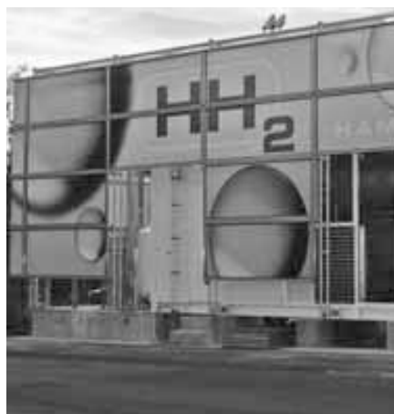
Glimt fra «Hydrogensamfunnet»: Stasjon for tanking av hydrogen for busser, Hamburg.

Norge har mye energi, og det produseres langt mer enn det nasjonen forbruker. Norge er en betydelig eksportør av olje og gass, men også elektrisitet, enten elektrisiteten er innbakt i produkter som har blitt foredlet i energiintensive prosesser (for eksempel i aluminium og papir), eller eksportert direkte på det nordiske el-nettet. Selv om Norge har rikelig med energi, har landet muligheter til å øke produksjonen ytterligere ved å utvikle innovasjoner innenfor nye energiteknologier, slik som brenselceller og relatert hydrogenteknologi. Dette gjelder utvikling av radikale innovasjoner. Vanligvis innebærer utvikling av radikale innovasjoner en betydelig risiko og krever stor innsats over lang tid. Nøkkelen til å lykkes er mer målbevisst satsing på FoU og innovasjonsaktiviteter knyttet til FoU-satsingen. Forsknings- og innovasjonspolitikken kan spille en avgjørende rolle i å utløse de mulighetene som finnes i Norge. Denne påstanden er basert på en undersøkelse som NIFU STEP har utført som ledd i et større OECD-prosjekt om innovasjoner i energisektoren.