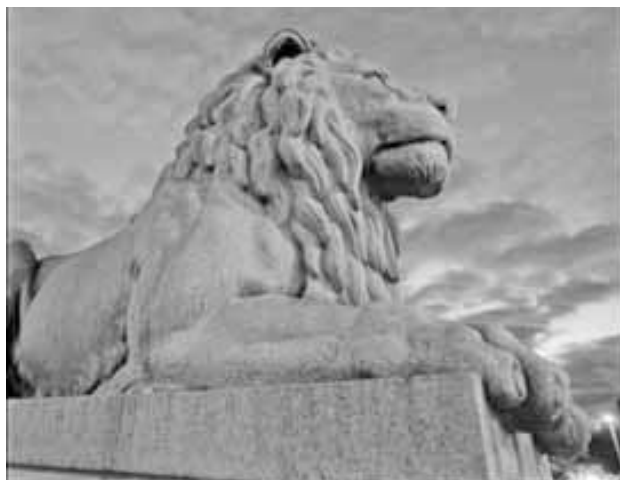
Teknologirådet godt vokter av løvene foran Stortinget (foto: Stein J. Børge/Scanpix).

ring med vekt på offentlig debatt og lekdelaktelse. Organet skulle ha nær tilknytning til Stortinget, og på et tidspunkt ble det vurdert om Stortinget skulle gå til det uvanlige skritt å legge organet direkte under Stortinget selv.