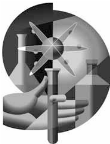
Ørsmå forskningsobjekter med revolusjonerende rekkevidde

I løpet av de siste 30 årene kan Boston dessuten smykke seg med høyest antall nobelprisvinnere (11) innenfor fysiologi og medisin. Harvard Medical School og Massachusetts Institute of