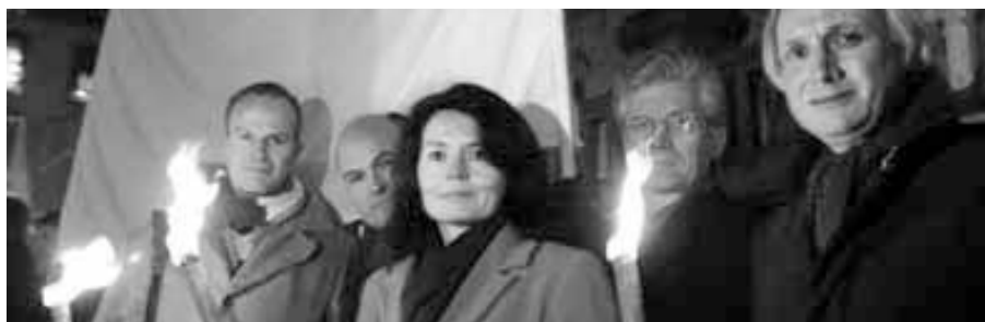
Noen akademikere er mer bekymret enn andre. Fakkeltog, Oslo, 26.01.05.

jøene i verden kan være preget av negative kjennetegn som høyt arbeidspress og mange vanskelige spenningsforhold. Noen trives med dette, men når forsk-