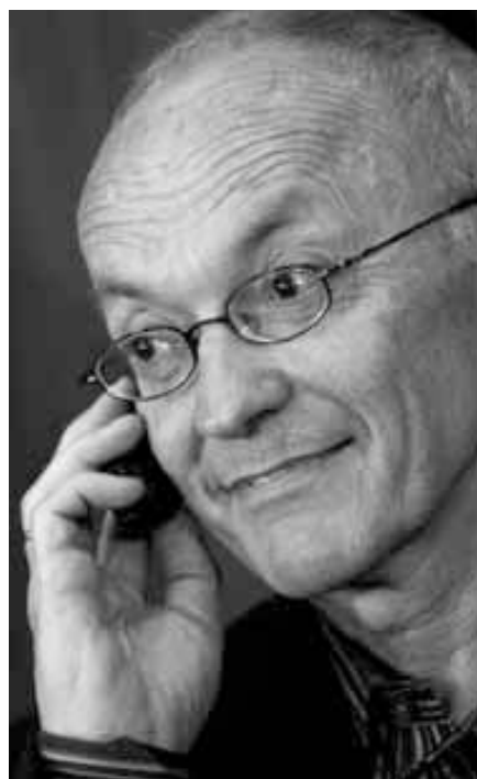
Nobelprisvinnerne Finn E. Kydlands (bildet) og Edward C. Prescotts arbeid "Rules rather than discretion – inconsistency of optimal plans" fra 1977 er sitert 820 ganger

Slik bruk er basert på antagelsen om at vitenskapelige publikasjoner blir oftere eller sjeldnere sitert ut fra hvor stor eller liten innflytelse de får på den videre