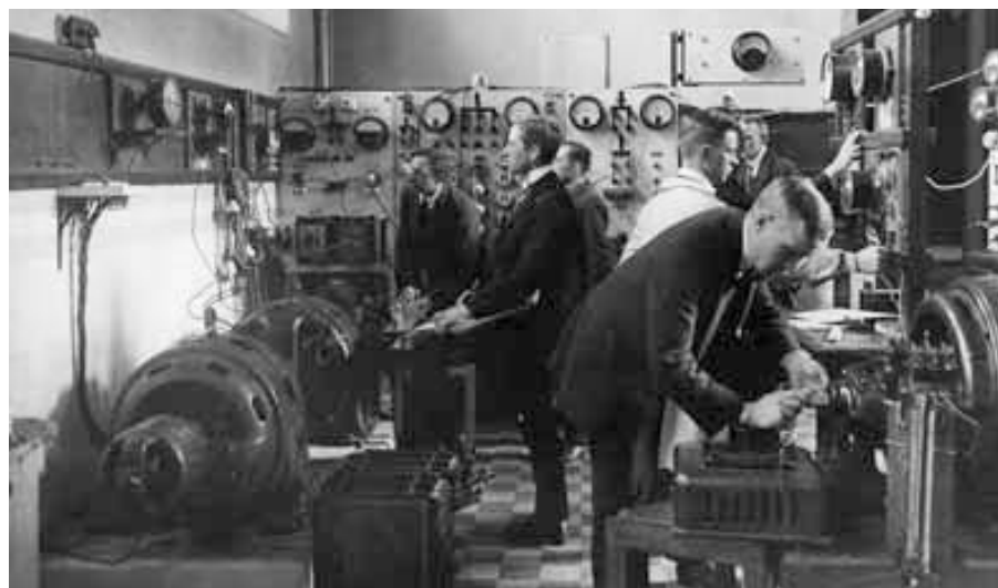
Bildet fra 1913 viser Chalmers store maskinsal