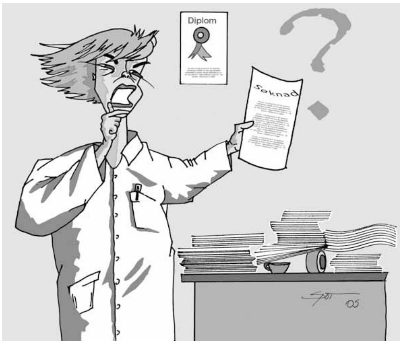
En av grunnene til at kvinner avanserer saktere i akademia enn menn kan være at de vurderer forskningsmiljøet noe mer negativt enn menn (Illustrasjon: SPOT)