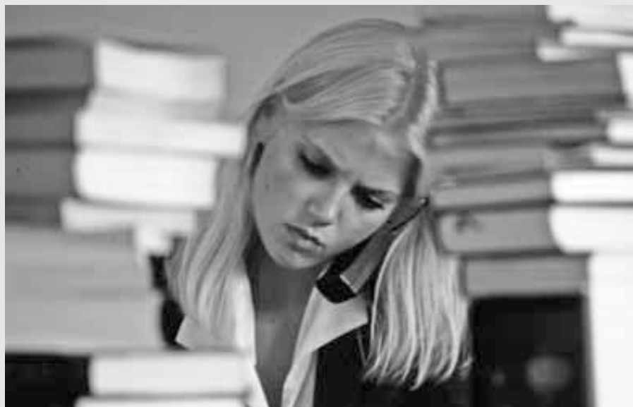
Studerer hun i Norden ved en offentlig utdanningsinstitusjon, slipper hun med all sannsynlighet å betale studieavgift

ne er relativt høye, men mange studenter mottar offentlig støtte. Storbritannia og Nederland tilhører denne modellen.