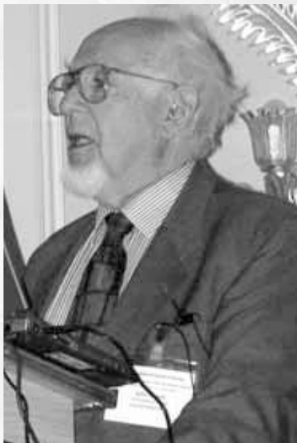
John Ziman 1925–2005

Det norske Nærings- og handelsdepartementet framstår nå som et styrket forskningsdepartement. Tre seksjoner skal forme departementets forsknings- og innovasjonspolitik: Seksjon for forskningspolitikk og utdanning, Seksjon for næringsrettet forskning og Seksjon for innovasjonspolitik. Hensikten er «økt fokus og gjennomslagskraft». Seksjonen for forskningspolitikk har bl.a. ansvaret for «... det faglige grunnlaget for og den overordnede innretningen av forskningspolitikken, strategisk forskning, ...» (www.dep.no). Trengs en ny grenseoppgang mot det koordinerende organ i norsk forskning: Utdannings- og forskningsdepartementet?