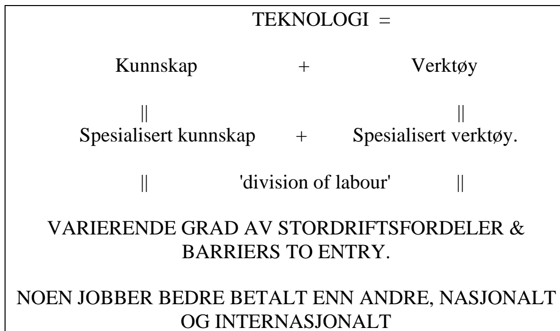
Skjema 1. 'Divison of labour' og roten til ujevn vekst.

Teknologi består av to elementer; et verktøy eller sett av verktøy, og kunnskap om hvordan dette verktøyet skal brukes. Ettersom verktøy over tid ble mere og mere sofistikert, krevet de også mere og mere spesialisert kunnskap. Investeringer i verktøy og i kunnskap krevet tid og kapital, og det foregikk en arbeidsdeling i samfunnet. Smedens kostnader til å holde ilden gående og hans årelange erfaring var begge deler fra et økonomisk synspunkt 'barriers to entry' som forhindret hvem som helst fra å bli smed på deltid. De faste kostnadene i utstyr, drift, og utdanning forårsaket og befestet den Smithske 'division of labour'. Et hovedpoeng i denne mekanismen er at det er eksistensen av 'barriers to entry' som muliggjør at smeden kan få betalt sine investeringer og sin utdanning og eksperimentering. Bak disse 'barriers to entry' - bestående av stordriftsfordeler forårsaket av faste kostnader og spesialisert informasjon - kan antagelig smeden opprettholde en høyere levestandard i samfunnet enn de medmennesker som arbeider uten faste kostnader og med kunnskap som er allemannseie. Mekanismen er forsøkt illustrert i Skjema 1.