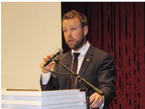
Kunnskapsminister Torbjørn Røe Isaksen innleder årskonferansen 2014

I Norge, som internasjonalt, har styringen av høyere utdanning beveget seg fra kollegial styring til profesjonell ledelse. Dette var tema for sesjon 2. For dem som skal lede i høyere utdanning, blir lederegenskaper og strategiske evner gradvis viktigere, mens vitenskapelige kvalitet fortsatt er viktig for at ledelse skal oppfattes som legitimt.