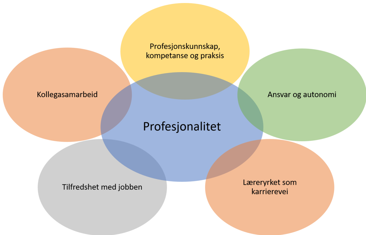
Figur 1.1. Fem hovedområder i TALIS 2018-undersøkelsen (oversatt og justert fra OECD, 2020).

Litt forenklet kan det sies at delrapport 1 tok opp tema om profesjonskunnskap, kompetanse og praksis (dvs. den gule delen øverst i figuren), mens delrapport 2 inndeles etter de fire øvrige delene som inngår i OECDs visuelle definisjon av profesjonalitet i skolen. I kapittel 1.2 gjengis oppsummeringen av hovedfunn fra delrapport 1, mens kapittel 1.3 beskriver hvordan de øvrige områdene i figuren er strukturert i denne andre delrapporten.